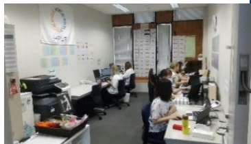
個室A (約25㎡) の使用例

入居にあたっては審査がありますが、埼玉県の公的施設に入居することで、実績が少ないベンチャー企業や開業したばかりの事業者にとっては取引先や人員採用の際の信用にもつながります。専門家による経営相談やコンシェルジュ機能が創業間もない入居者を手厚くサポートします。