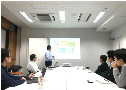
アトリ工積算株式会社