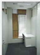
上左：A 個室型 上右：Bブース型 下：Cブース型