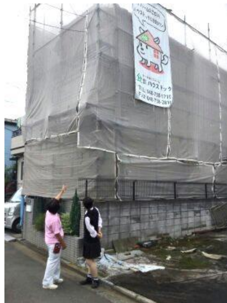
リフォーム現場での説明の様子

※ジョブシャドウイングとは、会社やお店等で「働いている人」に半日程度密着し、普段の仕事の様子を見て「職業観」や「しごと観」を養い、自分のこれからの学びや進路選択の一助にする春日部市の教育プログラムです。