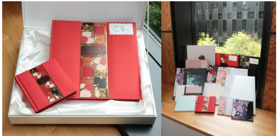
左：「はなごころミニ」、右：「はなごころ」 売上好調な最高品質のアルバム