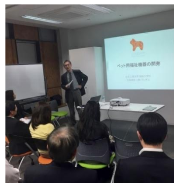
「ペット用福祉機器の開発」