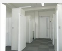
上左：A 個室型 上右：Bブース型 下：Cブース型