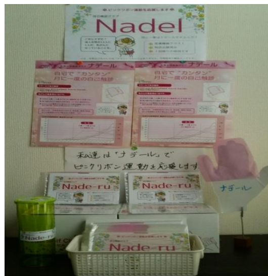
乳がん自己検診グッズ “ナデル”

本誌では創業支援ルームの入居者のご紹介をしております。 今回は、平成27年3月に入居された株ピーアールエスさんです。