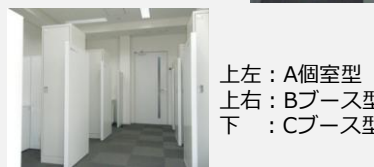
上左：A個室型 上右：Bブース型 下：Cブース型