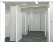
上左：A個室型 上右：Bブース型 下：Cブース型