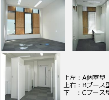
上左：A個室型 上右：Bブース型 下：Cブース型

ただいまインキュベート室（A室、B・Cブース）は満室ですが、ウエイティングリストへの登録は随時行っています。