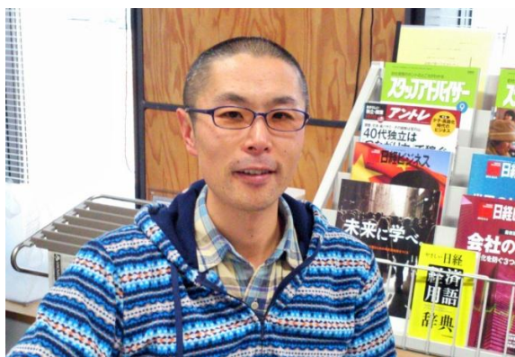
Cloud And Sky 染谷さん

本誌では創業支援ルームの入居者のご紹介をしております。 今回は平成25年10月から入居された、Cloud And Skyさんです。