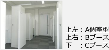
左上：A個室型 右上：Bブース型 下：Cブース型