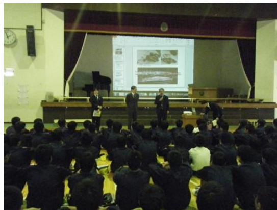
写真-1 体育館での授業風景

創業支援ルームと入居者は、豊春中学校からの依頼を受け、「(3) 会社経営」の中の「実際に起業している専門家の方の講義やアドバイスを受ける」というテーマに関して協力することになりました。