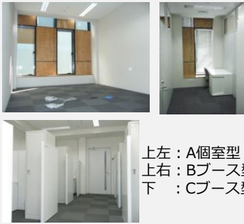
上左：A個室型 上右：Bブース型 下：Cブース型