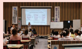
第1回セミナーの様子 (左)おこづかい会議を ひらこう (下)クイズだゼイ!