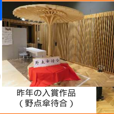
昨年の入賞作品 (野点傘待合)