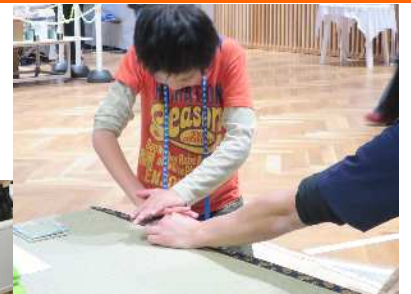
畳の手縫いを 体験