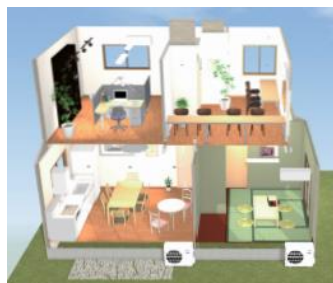
イメージパース図

起業家はもちろんテレワークでも使えますので、ご興味のある方は下記にお問い合わせください。