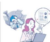
デジタルに関する相談▼