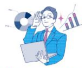
専門家紹介・連携先企業紹介▼