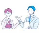
資金の支援(補助金・税制)▼