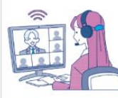
デジタルツール導入支援▼