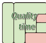
ロゴ (10月に変更予定)