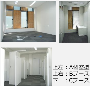
上左：A個室型 上右：Bブース型 下：Cブース型